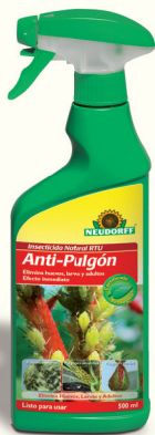
Insecticida Natural RTU Anti-Pulgón *(2)