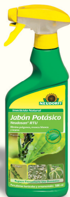
Insecticida Natural Jabón Potásico Neudosan RTU *(2)