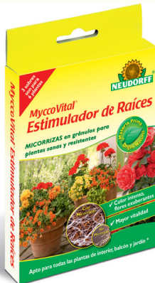
MyccoVital® Estimulador de Raíces Micorrizas